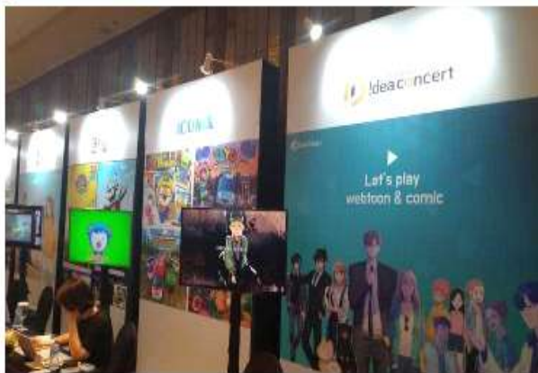
Beberapa perusahaan dan konten dari Korea mengikuti pameran Konten Kemitraan Korea-Indonesia yang digelar oleh Badan Promosi Industri Informasi dan Komunikasi (National IT Industry Promotion Agency/NIPA) Korea di Jakarta.